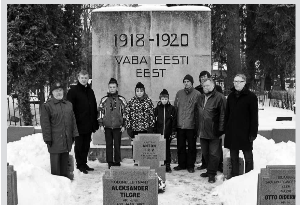
• Viljandis tähistasid Tartu rahu 93. aastapäeva lilled ja küünalde särava kindral Laidoneri mälestusmärgi juures ja Vabadussõja kalmistul maavanem, linna volikogu esimees ja abilinnapead ning Kaitseliidu Sakala Maleva esindaja ja noorkotkad oma juhtidega lisaks kümnete või isegi sadadele linnakodanikele, kes heiskasid oma majadel riigilipud ehk tähistasid seda sündmust perekonna ringis koos sõpradega. Meedia huvikeskmes oli sel päeval Viljandi talvine tantsupidu.

lahkulõõmiseni riigist, mille koosseisu nad kuuluvad“ – ja sealjuures Venemaa kindla üldkohustusena. Teiste sõnadega Tartu rahuleping oli ühtlasi vabaduskiri kõigile Vene impeeriumi rahvastele. Võib-olla sellepärast ongi ka praegused Venemaa valitsejad nii vihased sellele dokumendile ja püüavad seda teha nii olematuks kui kehtetuks, sest see on ju nõukogude impeeriumi taastada ihkavaile šovinistidele hullem kui punane rätik härjale. Neil on kahjuks ka mõningaid „advokaate“ siinpool Peipsit. Enne Tartu rahulepingut oli niisugune rahvaste õigus sõnasatunud vaid kahes deklaratiivses aktis, nimelt USA presidendi T. W. Wilsoni 1918. aasta kuulsas „14 punktis“ ja Lenini rahudekreedis. Deklaratsioon peab õigusteadus hea tahte aktideks, millel juriidiline jõud praktiliselt puudub. Neid võib muutunud olukorras unustada. Rahvusvaheline leping, iseäranis aga rahuleping, tähendab seevastu riigi kindlat sidumist, millest saab taganeda vaid rangelt piiratud erijuhtudel. Lepingust tuleb kinni pidada. See vankumatu norm on kogu rahvusvahelise õiguse alus ja nii iidne, et läänes kõneldakse sellest enamasti ladina keeles: pacata sunt servanda . Tartu rahuleping on võetud ÜRO kehtivate rahvusvaheliste lepingute registrisse nr 11LTS29 all. Mis puutub rahvaste enesemääramise õigusse kui kõigi riikide kohustusse, siis kaksikümne aastat hiljem kuulutati see välja nn. Atlandi Hartas, mis