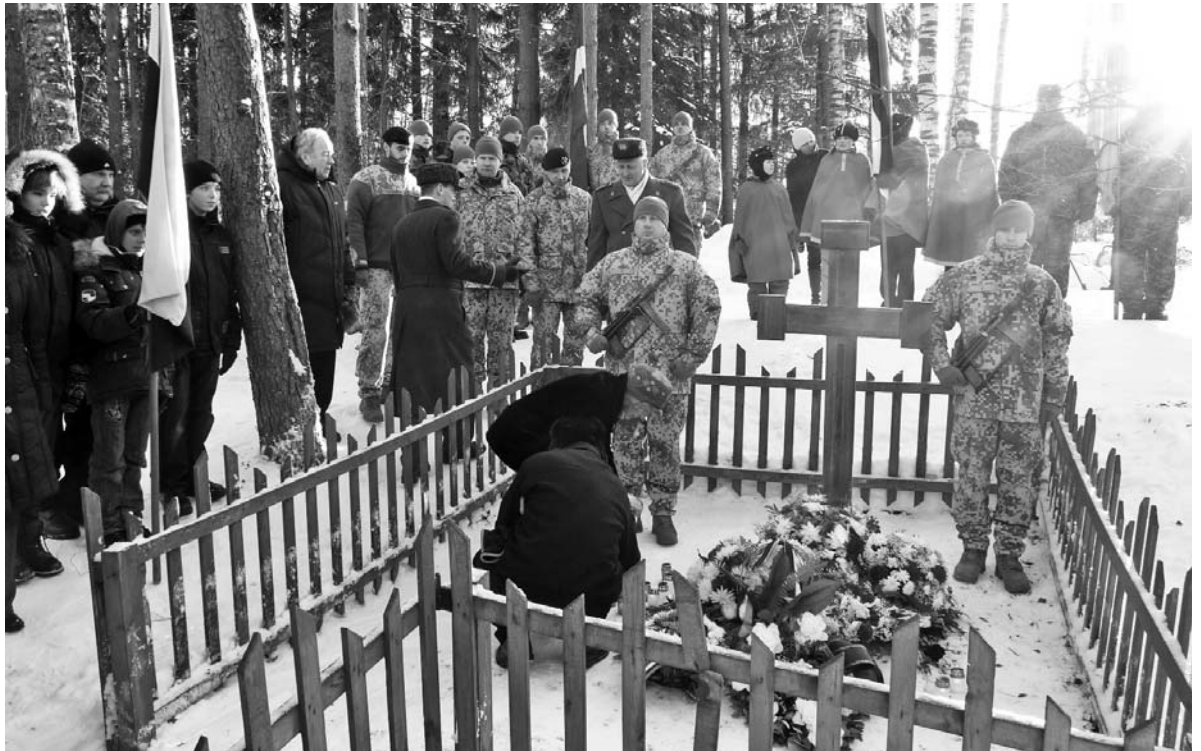
• Korneti küla rahvas meie tundmatut sõdurit austama kogunemas