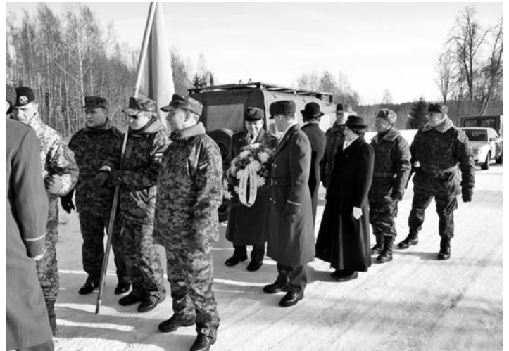
• Võrumaa maleva esindus Korneti külas