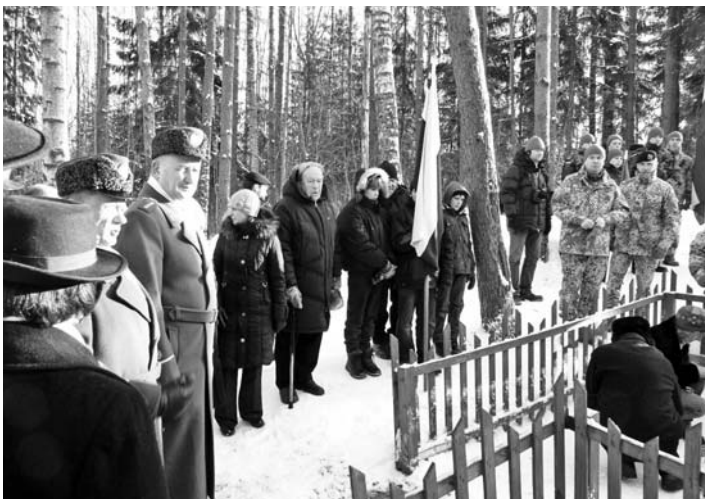
• 23. veebruaril Lätimaal Korneti külas