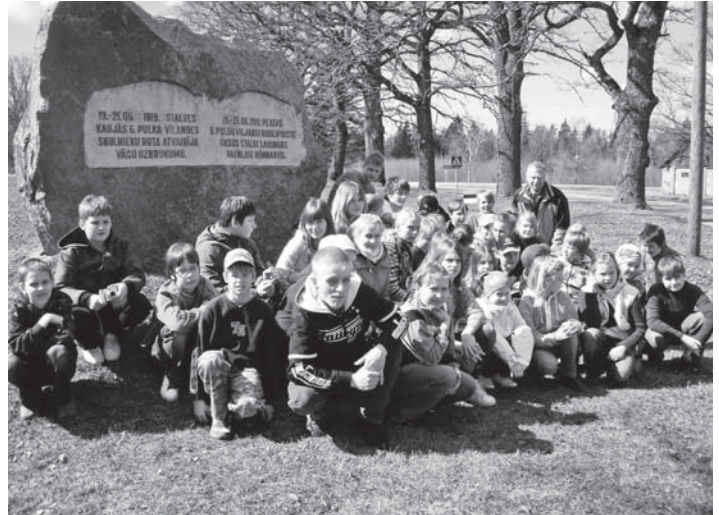
• Noored Stalbes Viljandi koolipoiste mälestuskivi juures