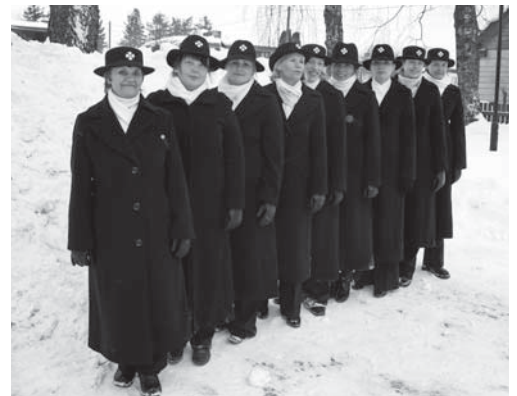
• Sakala naiskodukaitsjad täisvormis