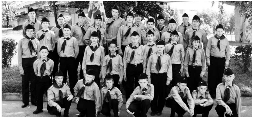
• Ikka reibas Alutaguse malev

Alutaguse malevas algab Noorte Kotkaste 80. aastapäeva tähistamine 28. mail õhtul rivistusega Sinimägedes. Toimuvad ajakohased kõned ja tänatakse tublimaid. Edasi liigutakse laagrikohta Sinimäe lahinguväljadele ja elatakse laagriolu 30. mail lõunani. Selle aja jooksul saadakse ülevaade Sinimägedega seotud ajaloo ja tegutsesetse aktiivselt kohalike giidide juhtimisel. Viimasel päeval läbivad rühmade neljalikmelised võistkonnad oskusteraja. Oskusterajal tuleb orienteeruda Sinimägede vahel ja lahendada leitud punktides meeskonnatöö ülesandeid. Üritusel osalevad külalistel Sakala maleva noorkotkad.