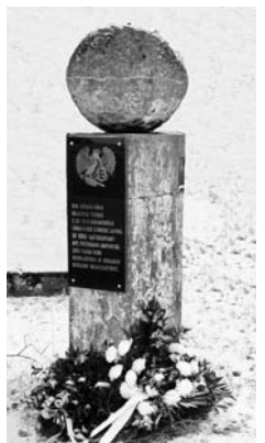
• Lõunarinde esimese lahingu mälestusmärk Võrumaal Nõnova külas. Avatud 5. detsembril 2008 tänu kompanii pealikule Aare Hõrna ettevõtlikkusele ning maleva pealikule Kalev Aderi ja Lasva vallavanema Jüri Nassari abile