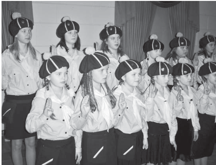
• Eesreas Männimäe kodutütred

Ole alati valmis tegudeks, mida kunagi ei tule kahetseda; püüa teha head, see rikastab sind; õpi hästi tundma oma põlist kodumaad, see sisendab ausust karni ajaloo vastu. Proovi tunnetada, et eestlane, sinu esiisa, pole siia rännanud, vaid siin kujunenud. See on meie ja ainus meie päriskodu. Paljud rahvad ei saa sama väita oma maa kohta, mida nad parajasti sõtkuvad. See teadmine muudab sind väarikaks. Ära alandu suurte ees seepärast, et nad on sinust suuremad. Suurus ei tähenda veel tarkust ega headust. Sakala malev hakkas taastuma 1989. aasta suvel. Esi-