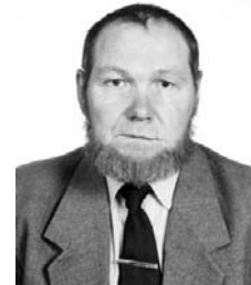
Jõudu sulle paljudeks aastateks austatud „Oma Maa“ toimetust.